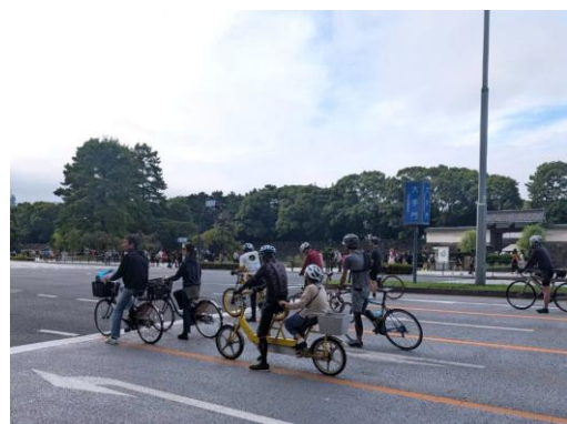
パレスサイクリング風景