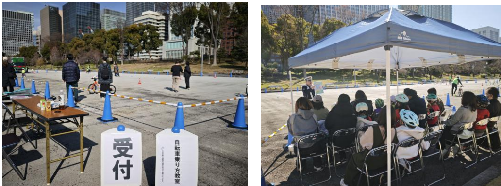
自転車乗り方教室風景