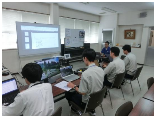
9月4日 第2回 ISO/TC149 国内委員会/第3回 WG13 国内対応分科会