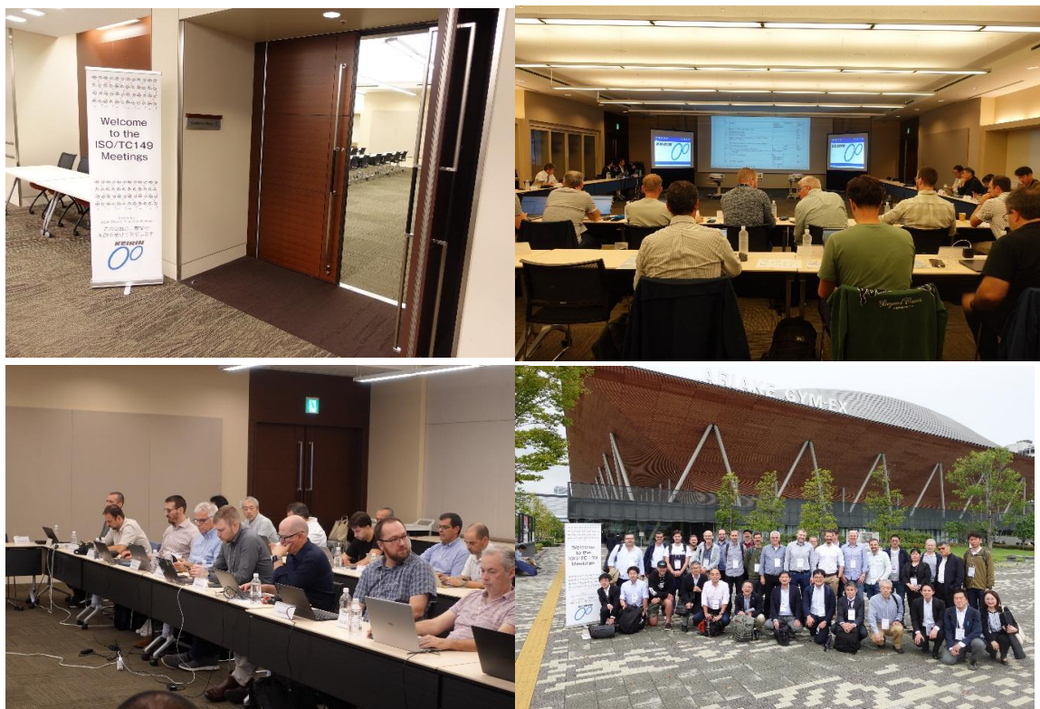
10月14～17日 ISO/TC149国際会議（東京会場）