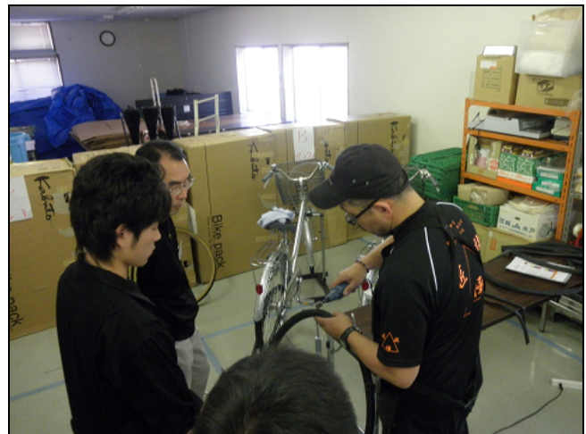
実技講習「パンク修理」